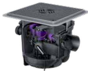
L'illustration montre Réf. # 280 451S