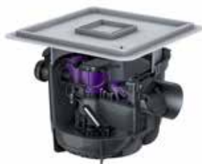
L'illustration montre Réf. # 280 451X