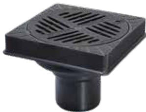
L'illustration montre Réf. # 67 110B

➤ Accessoires : Multistop Réf. # 48 500 voir page 288