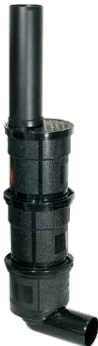
L'illustration montre Réf. # 67 970