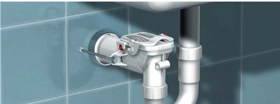
... wasbakken met stankafsluiters