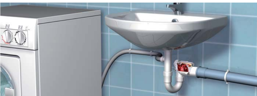
... wasbakken met stankafsluiters en aansluiting voor wasmachine