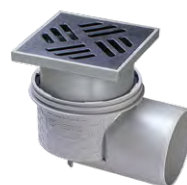
Afbeelding toont Art. Nr. 45 110.40 (zijwaartse afvoer)