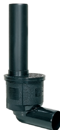
Rys.: artykuł 67 945