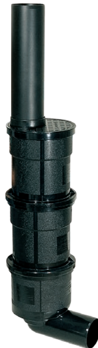
Rys.: artykuł 67 970