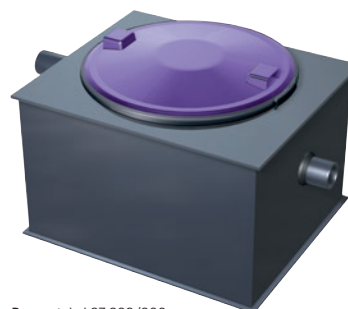
Rys.: artykuł 97 202/000