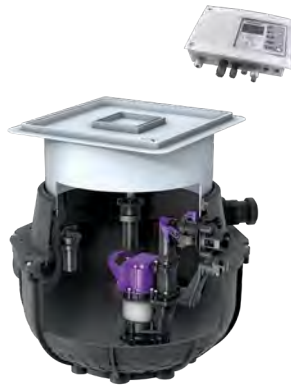
Abb.: Artikel 280 550X