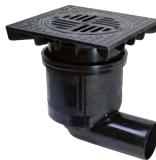
Abb.: Artikel 67 020.30