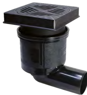
Abb.: Artikel 67 923B