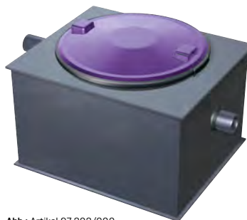
Abb.: Artikel 97 202/000

Anmerkung: Weitere Nenngrößen auf Anfrage